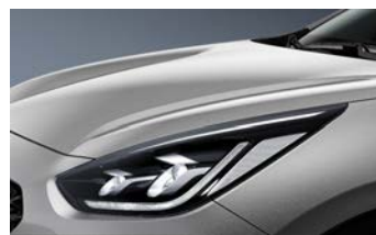
Silky Silver (4SS)