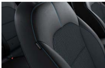
Sedili in misto pelle/tessuto