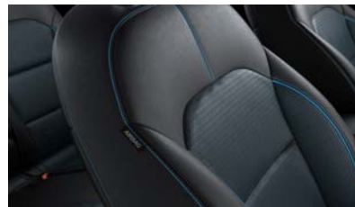
Sedili in pelle