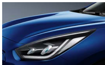
Yacht Blue (DU3)