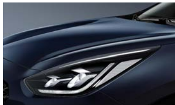
Gravity Blue (B4U)