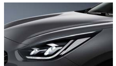
Platinum Graphite (ABT)