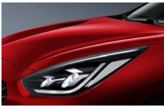
Runway Red (CR5)