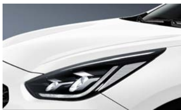
Clear White (UD)