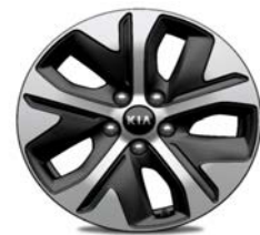
Cerchi in Lega da 17" 215/55 R17